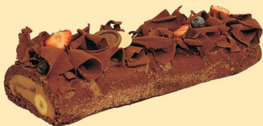
Pařížský rolovaný dort