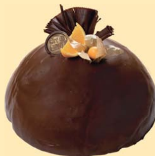
Vanilková kopule s pomeranči