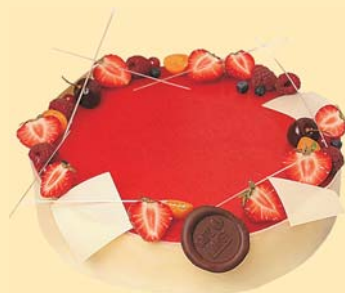
Tvarohový dort s jahodami